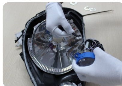
3. соедините провод и линзу