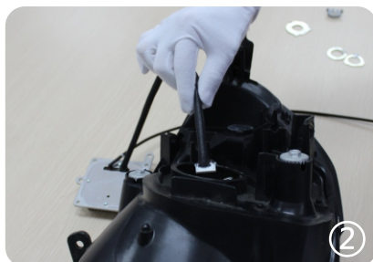
2. пропустите провод контрольного блока через фару