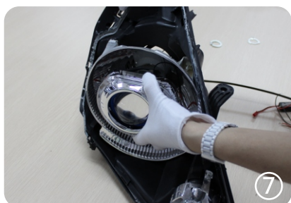
7. установите маску (если есть в комплекте)