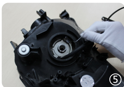
5. установите линзу Interpower