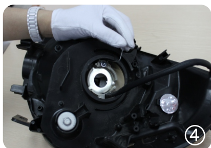
4. закрепите переходник на задней стороне фары