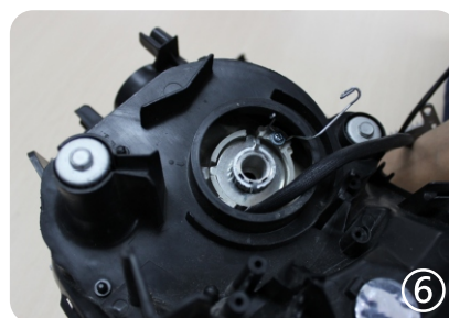
6. установите закрепительное кольцо и закрутите его