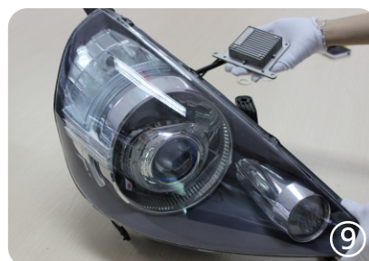
9. закройте фару

Порядок установки переходников: силиконовая вставка - переходник - закрепительное кольцо