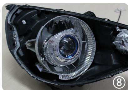
8. закрепите и проверьте работу линзы